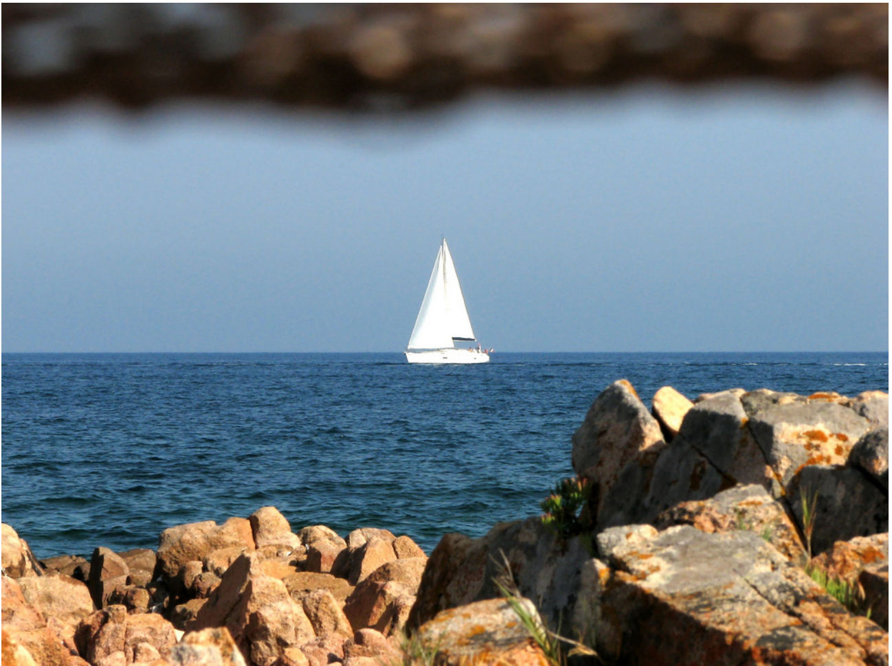
La vela è un'avventura che riporta al passato http://goo.gl/rd0lnU

Sempre più turisti scelgono di trascorrere le loro vacanze in barca. La vela è un'avventura che richiama sensazioni ancestrali, permette di tuffarsi nella natura e al tempo stesso misurarsi con se stessi. Il territorio sardo offre condizioni ideali sia per chi vuole imparare a navigare sia per chi pratica questo sport a livello agonistico. Numerose le regate organizzate nei litorali sardi, sempre con tanti iscritti. Nella costa orientale le località più gettonate sono Porto Ottiolu a San Teodoro, la Marina di Porto Rotondo e Porto Cervo. A Nord spicca l'Arcipelago di La Maddalena, nel versante occidentale il porto di Alghero.